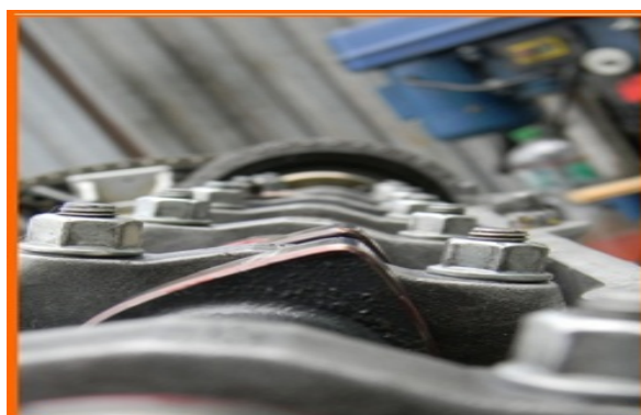
Seryjny wałek m50